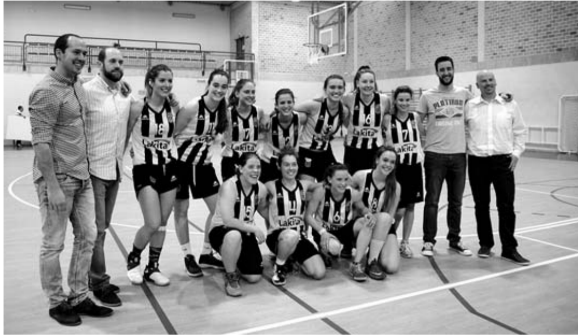
El Lagunak Lakita se proclamó campeón de liga en pasado sábado a falta de una jornada.